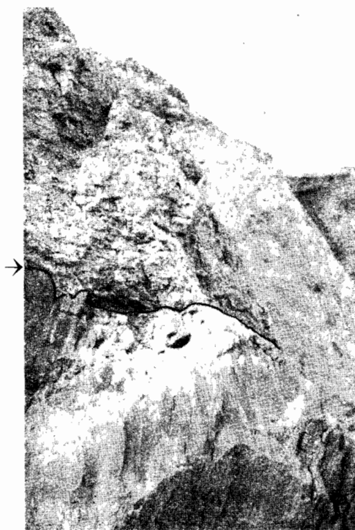
Рис. 1. Благовещенский карьер. Контакт костеносного горизонта с гранито—гнейсами.

Костеносный горизонт, вскрывающийся в карьере под г. Благо-