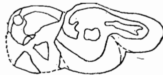
图4 Heothema angnsticalxia M 3 构造示意图, 1/2

比较与讨论 为一种比 Heothema chengbiensis 稍大一些的石炭兽。除了个体较大不同外, M 3 的构造也有所不同, 如前谷、后谷和后跟谷皆为封闭的窝; 后跟明显的窄长, 其宽度大于齿宽的一半; 下前尖较退化。同 Heothema media 比较, 除 Heothema media 个体小的多外, 其前谷、后谷和后跟谷均未全部封闭, 后跟亦较宽, 在下次小尖与后谷后壁相连的脊上有一较大的附尖。因此, 与上述种所描述的不同特征, 可以看出 Heothema angnsticalxia 具有较清楚的脊及所形成封闭的前谷、后谷和后跟谷, 下前尖较小退化, 以及个体较大等特征, 反应了一定的进步性质。因此, 有别于上述石炭兽。