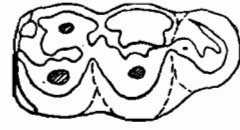
图3 Heothema media M 3 构造示意图, 1/2

除个体大的多外与后者不同的还有前谷和后谷的前壁几封闭, 两谷皆浅, 尤以前者显著。下后尖和下内尖的第二脊短粗。下前尖较退化。后跟短宽, 下次小尖与后谷后壁间的附尖明显, 谷口的齿缘稍发育等。同苏联 Anthracotheium kwablianicum 的个体较接近, 稍小一些。田东的标本下前尖虽退化但明显, 位于下后尖的正前方, 与 Anthracotheium kwablianicum 位于下后尖前外侧退化的下前尖显然不同。因此, 有别于两者。为 Heothema 属中一中等大小个体的石炭兽。