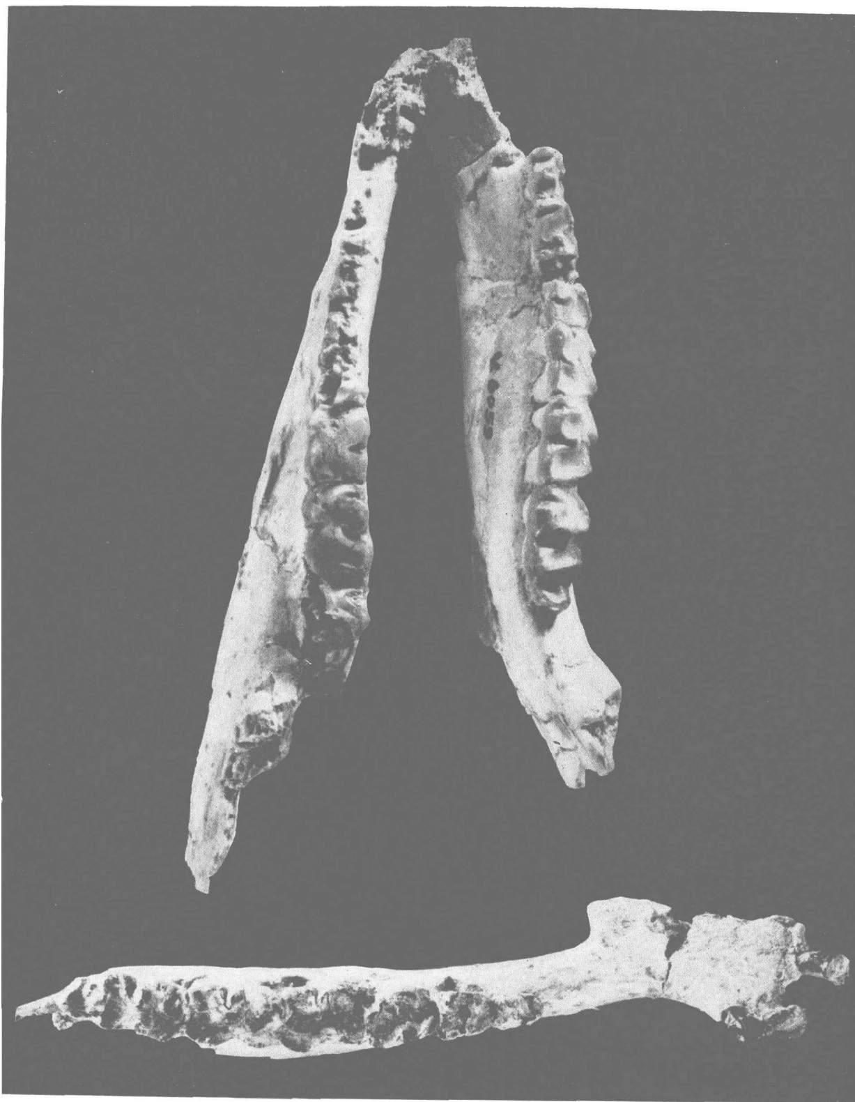
上: Simplaletes ulanshirehensis , V 6059, 下颌骨冠视 下: Simplaletes sujiensis , V 6058, 下颌骨冠视, 全部 \times 1.5