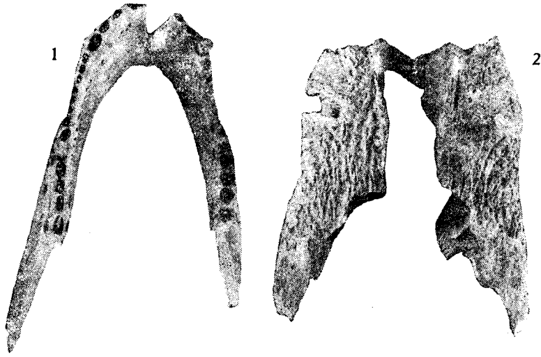
图3 中国鳄相似种 ( Alligator cf. sinensis )