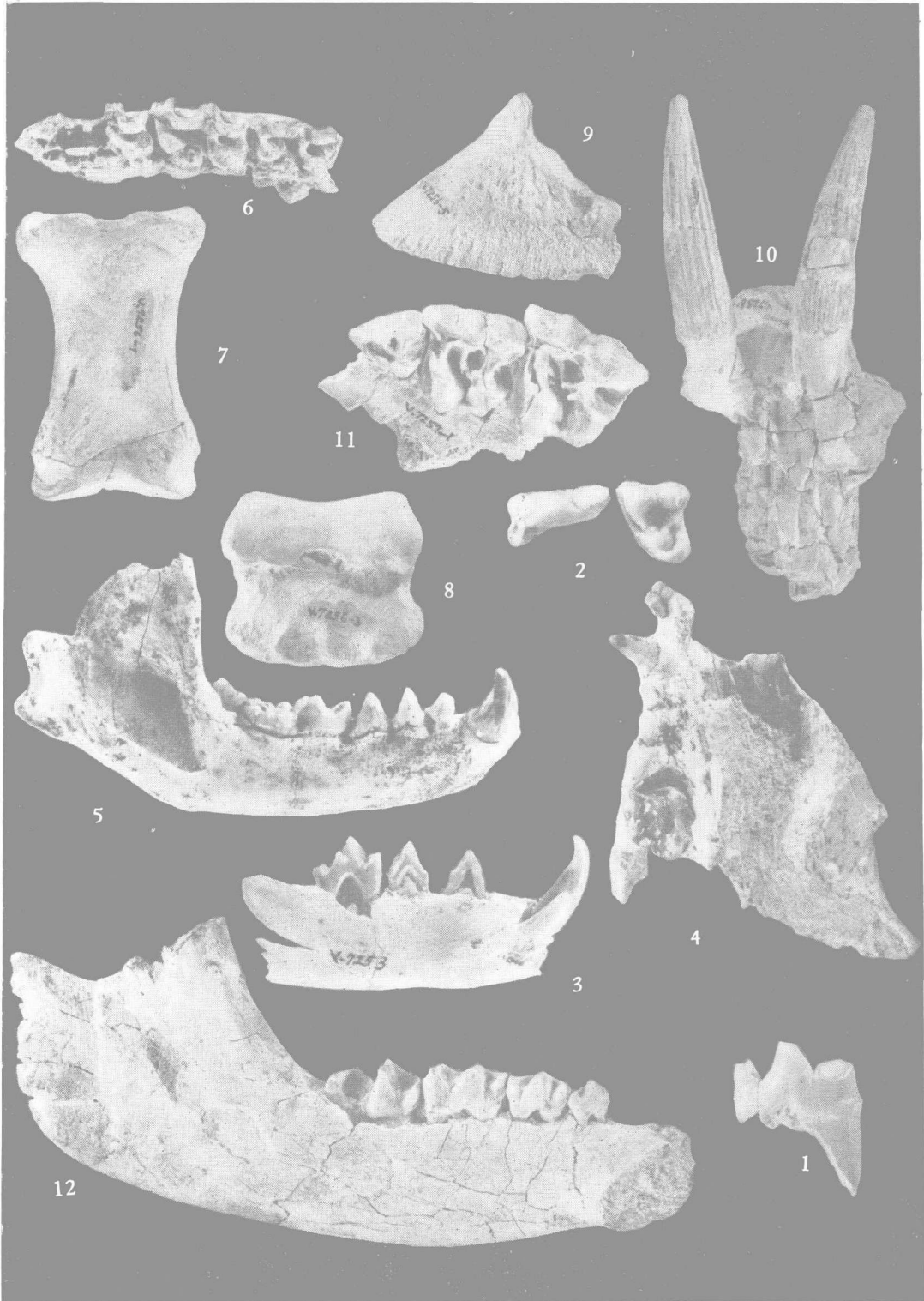
1. Hyaena sp. 右下 DM_1 (V 7251), 唇面视 \times 1 ; 2. Canis chihliensis minor 左上 P^4 , M^1 (V 7252. 1—2) 冠面视 \times 1 ; 3. Vulpes sp. 左下颌骨带 DC, DP_2 — DM_1 (V 7253) 舌面视 \times 1 . 4—5. Meles chiai , 4. 右下颌带有完整齿列 (V 7254—1) 唇面视 \times 1/2 ; 5. 右上颌带完整齿列 (V 7254—2) 冠面视 \times 1/2 ; 6. Proboscidea sinense (V 7255), 左 DP^2 — DP^4 , 冠面视 \times 1/2 ; 7—9. Equus sanmeniensis , 7. 第一趾骨 (V 7256—1) 前面视 \times 1/2 ; 8. 第二趾骨 (V 7256—2) 背面视 \times 1/2 ; 9. 第三趾骨 (V 7256—3) 侧面视 \times 1/2 ; 10. Gazella sinensis 残破头骨带二角心 (V 7258—1) 顶面视 \times 1/3 ; 11—12. Coelodonta antiquitatis , 11. DP^1 — DP^3 齿列 (V 7257—1) \times 1/3 ; 冠面视, 12. 左下颌带 DP_1 — DP_4 齿列 (V 7257—2) 唇面视 \times 1/3