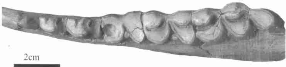
图 2 长吻蓝田羊(新属新种)的下颌骨冠面