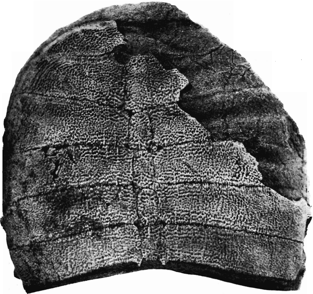
圖 2. (Fig. 2) Trionyx (? Aspideretes ) sinuosus Chow et Yeh, sp. nov.